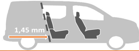
Бокове сидіння складене та відкрите вікно в перегородці